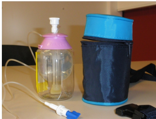
De elastomeerpomp: bij de start (grote ballon) + bijhorend heuptasje