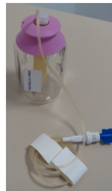
De elastomeerpomp: voor afsluiten (staafje = lege ballon)